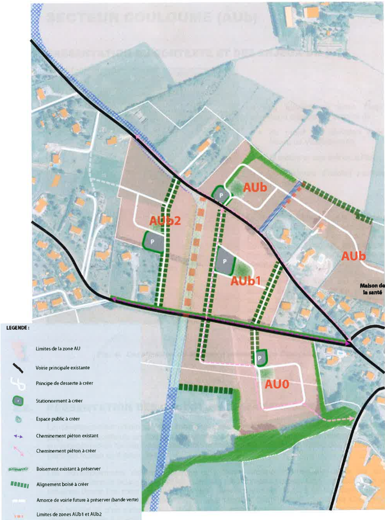
Fig. 5. Schéma d'aménagement du secteur Ribadiou